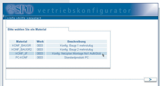
Webfrontend zur Bedienung einer Materialkonfiguration in SAP R/3