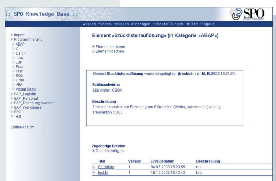
SPO Knowledge Base